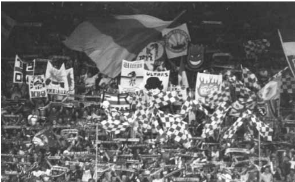
SCF – Eintracht Frankfurt