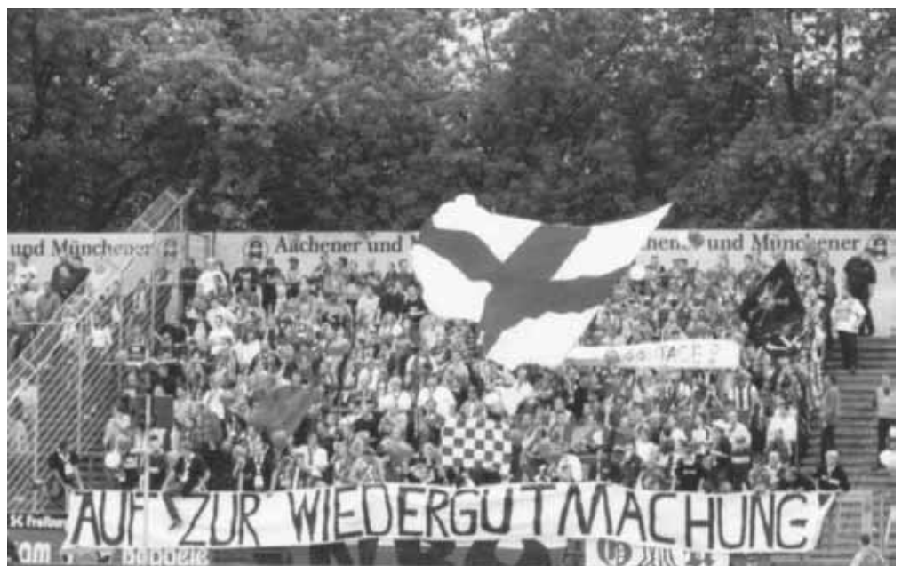
Alemania Aachen - SCF